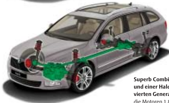
Superb Combi mit 4x4 Allradantrieb und einer Haldex-Kupplung der vierten Generation (erhältlich für die Motoren 1.8 I TSI mit 160 PS, 3.6 I V6 FSI mit 260 PS und 2.0 I TDI CR D-PF mit 170 PS)