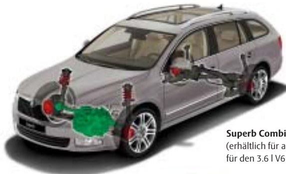
Superb Combi mit Frontantrieb (erhältlich für alle Modelle außer für den 3.6 I V6 FSI Motor mit 260 PS)

Bei aufrecht stehenden Rückenlehnen (l) 633 Bei umgeklappten Rückenlehnen/Rücksitzen (l) 1.865